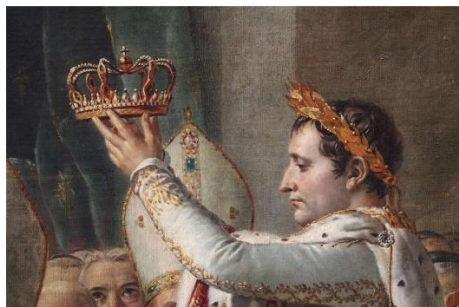
Jacques-Louis David, Le Sacre de Napoléon (détail), 1805-1807. Paris, musée du Louvre.

« Jacques-Louis David (1748-1825) : l'art régénéré »